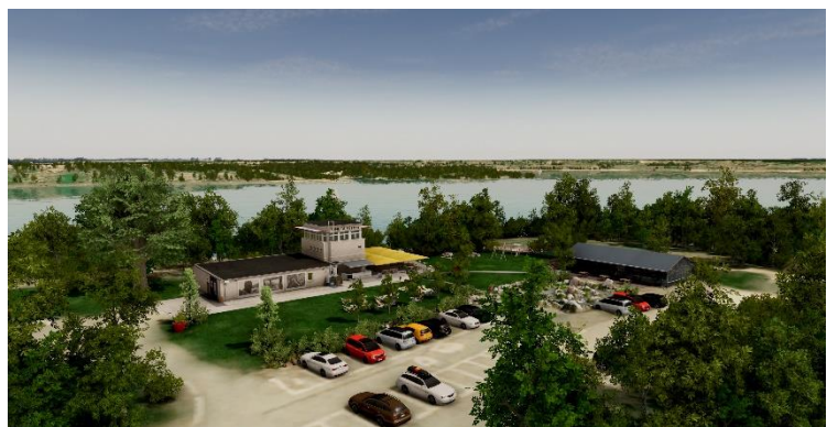
Bild: Krystallpalast Varieté ( https://www.vineta-stoermthal.de/touren-angebote/vr-vineta-rundflug )

sante Informationen zur Landschaft und VINETA vermittelt. Dieses einzigartige Projekt wurde durch Krystallpalast Varieté entwickelt und mit LEADER-Mitteln unterstützt. Es steht Bewohnern der Region, Gästen und Besuchern zur Verfügung. Informationen erhält man vor Ort oder auf den Internetseiten des Krystallpalast Varieté / Vineta-Störnthal ( https://www.vineta-stoermthal.de ).